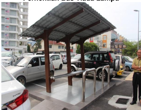
Gambar 1.5 Perhentian Bas Tiada Lampu

Lokasi: Tempat Letak Kereta UTC Bandar Melaka Tarikh: 12 November 2014