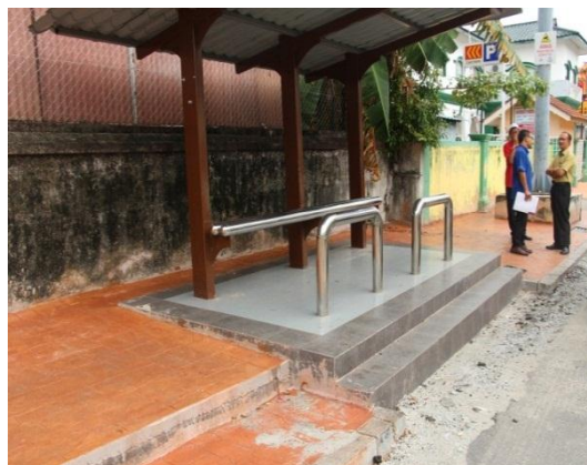
Gambar 1.4 Tiada Ram Untuk Kemudahan Kerusi Roda

Lokasi: Jonker Walk, Melaka Tarikh: 12 November 2014