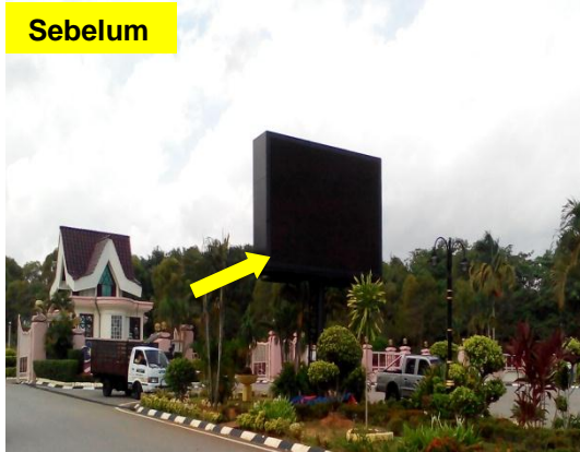
Gambar 2.1 Pembekalan Dan Pemasangan Outdoor Steel LED Display Di Pintu Masuk Seri Negeri

Lokasi: Seri Negeri, Ayer Keroh Tarikh: 19 Mei 2014