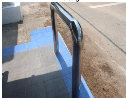
Gambar 1.3 Ram Untuk Kerusi Roda Dihalang Oleh Palang

Sumber: Jabatan Audit Negara Lokasi: Pantai Puteri, Klebang, Melaka Tarikh: 12 November 2014