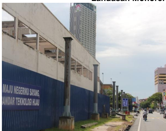
Landasan Monorel Fasa 2 Yang Tidak Siap

Lokasi: Jalan Tun Ali, Bandar Melaka Tarikh: 14 November 2014