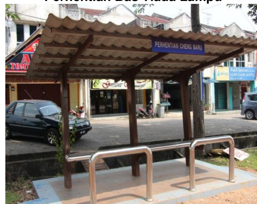
Gambar 1.6 Perhentian Bas Tiada Lampu

Lokasi: Cheng, Melaka Tarikh: 12 November 2014